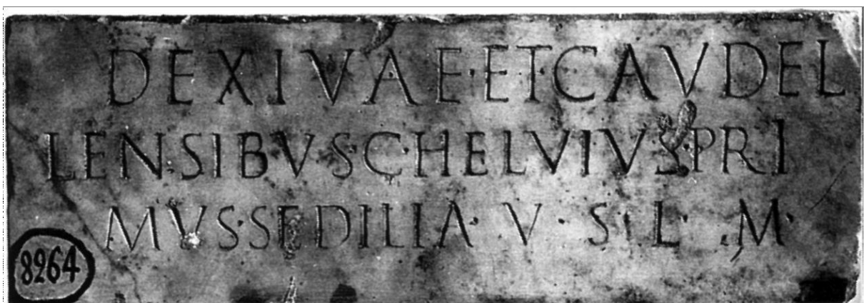
Inscription de Cadenet (84)

Remarque importante : les textes latins seront tous traduits. Ce cours a été conçu pour les étudiants non-latinistes.