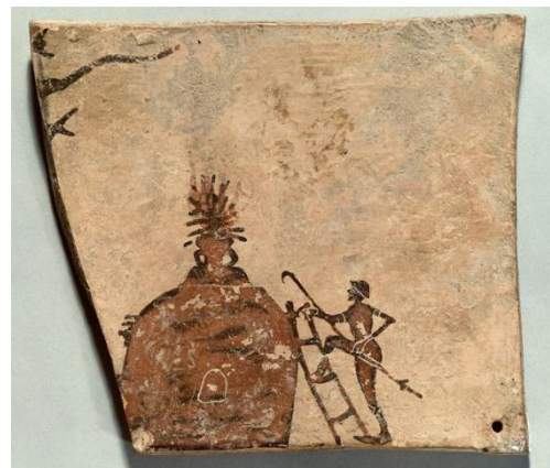
Le potier et son four (Berlin F802)